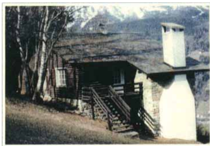
Bormio – La Trappola